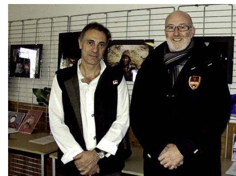
Avec Mr. le Maire de Sorbiers

La journée portes-ouvertes du 27 novembre 2010, s'est déroulée comme chaque année Salle du 3 ème Age à Sorbiers. Le film de Dominique, qui conte la première journée, d'une petite fille de la région de Lumla, à l'école que nous venons d'y construire, a été particulièrement apprécié.