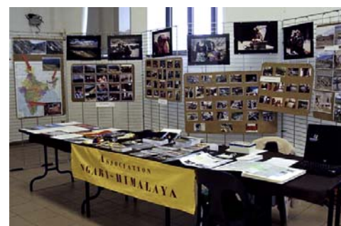
"Festival Planète Couleurs"

C'est avec beaucoup de plaisir que nous avons pu constater une authentique sympathie et un réel intérêt pour celles-ci.